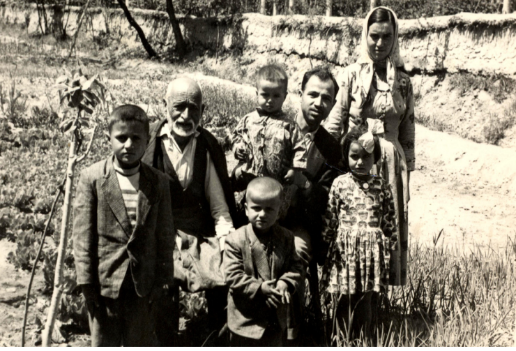
Ulu Cami önünde, 17.1.1966